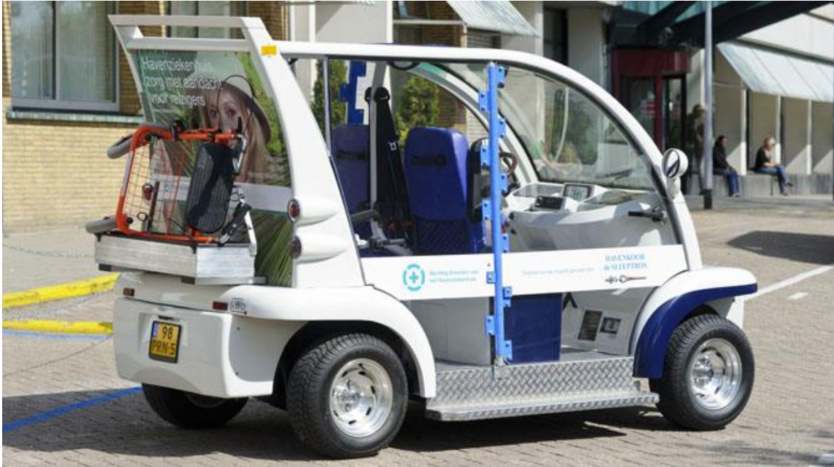
“de Sleetro” ; de elektrische patiënten taxi van het Havenziekenhuis

Goed gepromoot op de website van het Havenziekenhuis.